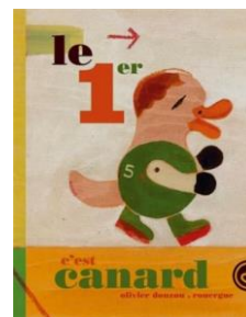
« Le premier c'est Canard » Olivier DOUZOU

La « sélection de Marie » des albums pour jeunes enfants