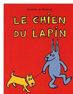
« Le chien du lapin » Dorothée de MONFREIT